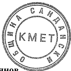
Атанас Стоянов Кмет на община Сандански

2. Възлага на кмета на община Сандански да предприеме необходимите действия за промяната.