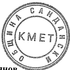
Атанас Стоянов Кмет на община Сандански