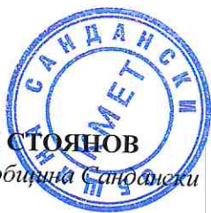
АТАНАС СТОЯНОВ Кмет на община Сандански

В изпълнение на изискванията на Закона за нормативните актове е извършена предварителна оценка на въздействието на проекта на подзаконовия нормативен акт.