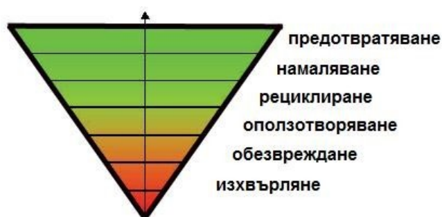
Политиката за управление на отпадъците

Настоящата Програма е насочена към подобряване на организацията за управление и намаляване количеството на образуваните отпадъци в община Сандански и създава необходимите предпоставки за успешна реализация на планираните мерки и дейности.