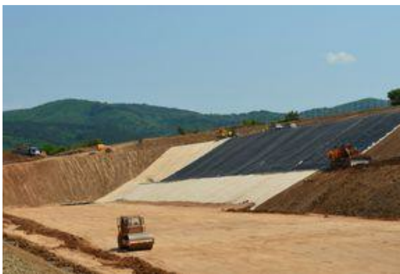
Регионално депо за битови отпадъци - Сандански

Остатъчните битови отпадъци се обезвреждат съобразно нормативните изисквания през целия период на Програмата